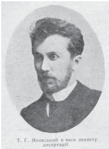
Ф. Г. Яновський під час захисту дисертації, 1890 р.

сандрівської лікарні, успішно захищає докторську дисертацію на тему "До біології тифозних бацил". У цій дисертаційній роботі він дослідив не лише особливості тифозних паличок, умови їх існування в навколишньому середовищі, але і знайшов спосіб знешкодження цього збудника. Він вперше встановив бактерицидну дію ультрафіолетових променів на паличку черевного тифу. Водночас виходять з друку його наукові праці: "Бактеріологічне дослідження дніпровської води у Києві", де Феофіл Гаврилович зазначає добрі її властивості на відміну від інших річок, адже бактерій у дніпровській воді було від 700 до 2,880 на 1 куб. см. водної проби. У праці "Бактеріологічне дослідження снігу" описується бактеріологічний аналіз снігу, який щойно випав і який лежав протягом різного часу, при різній температурі повітря. У роботі "Діагностична цінність дослідження крові на присутність тифозних бацил" автор повідомляє про негативні наслідки засіву крові черевнотифозних хворих на різних середовищах, внаслідок чого такий метод, на думку Ф. Г. Яновського, не має великого діагностичного значення [1].