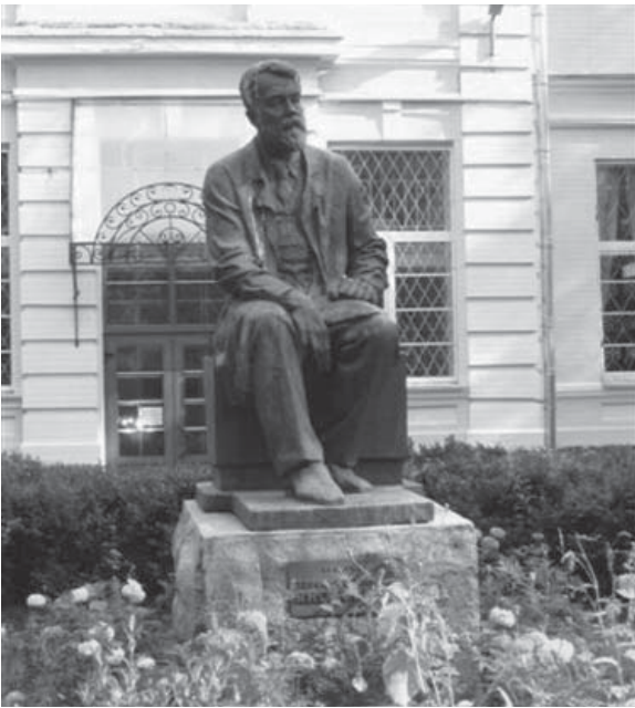
З ініціативи О.С. Мамолати перед фасадом інституту споруджено пам'ятник видатному лікарю-гуманісту академіку Ф.Г. Яновському (скульптор — народний художник України О. Скобликов, архітектор — М. Кислий)

ли поїздки до Парижу. Однак, через необхідність хірургічного втручання з приводу вентральної грижі у дружини Феофіла Гавриловича поїздки була відкладена. Та через 3 дні після операції Ганни Яновської прибула звістка про смерть дочки, внаслідок чого у матері виник реактивний стан з депресивним синдромом, який прогресував та набув тяжкого перебігу, до якого приєдналося ще й запалення легень. Через півтора року дружина Ф. Г. Яновського померла.