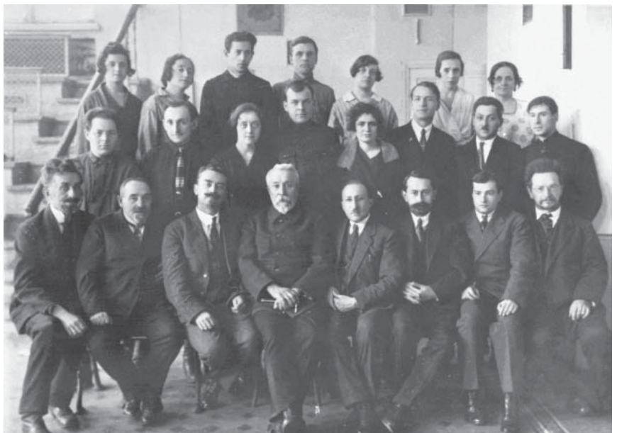
Академік Ф. Г. Яновський з учнями на кафедрі внутрішньої медицини (1926 р.)

Ентузіазм і невичерпна енергія Ф. Г. Яновського, який стояв на чолі ініціативної групи професорів Університету св. Володимира, призвели до створення у 1896 р. Бактеріологічного інституту (зараз Київський науково-дослідний інститут епідеміології та інфекційних хвороб імені Л. В. Громашевського). Його збудовано за рахунок коштів меценатів, цукрозаводчиків Терещенка та Бродського, які фінансували побудову закладів загальнономіського значення, та частково на кошти киян. У день відкриття Бактеріологічного інституту 21 жовтня 1896 р. винахідник вітчизняної протидифтерійної сироватки