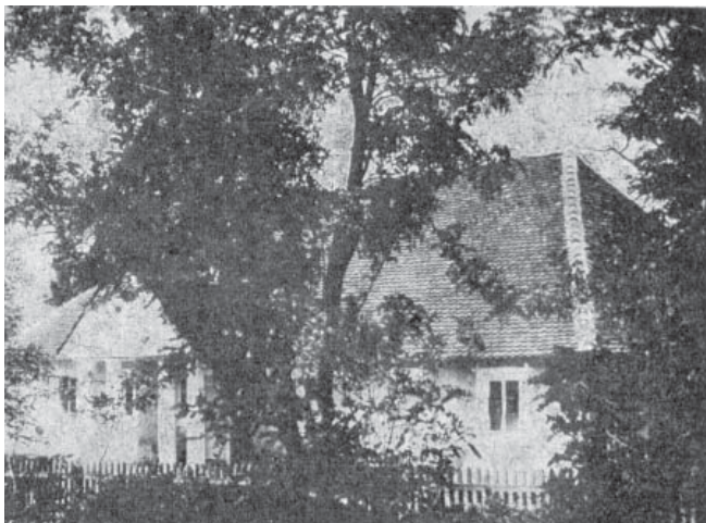
Будинок в с. Миньківці, де народився Ф.Г. Яновський

Величезний вклад вченого у вивчення проблеми туберкульозу, зокрема він розробляв особливості етіо-