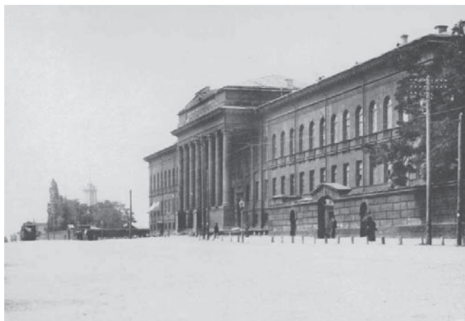
Університет св. Володимира

В університеті, під впливом вчителів — Володимира Олексійовича Беца, анатома, який відкрив дорогу неврології та психіатрії, Григорія Миколайовича Мінха, епідеміолога, завідувача кафедрою патологічної анатомії та професо-